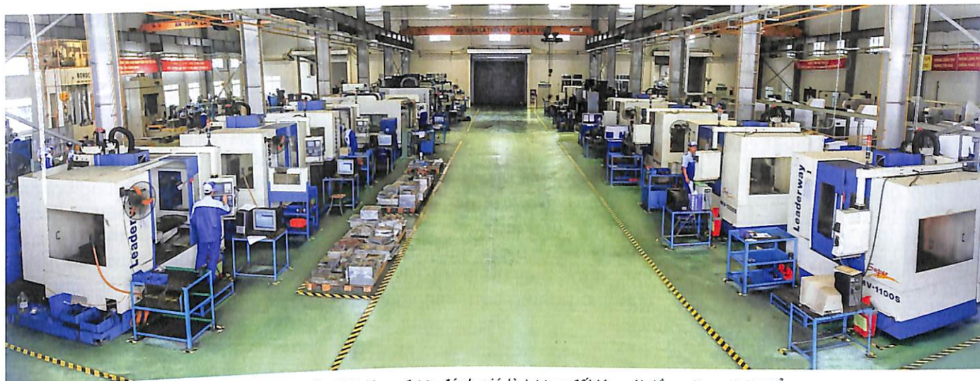
Thị trường khuôn mẫu Việt Nam được đánh giá là tương đối lớn với tiềm năng phát triển cao

Ngoài ra, trong nước còn thiếu nhân lực thiết kế chất lượng cao, có kinh nghiệm trong thiết kế các kết cấu khuôn phức tạp cũng như am hiểu quy trình công nghệ và các phương pháp gia công tiên tiến.