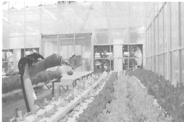
Robot số 1 làm nhiệm vụ nhặt khay cây.

Công ty khởi nghiệp của Mỹ có tên Iron Ox đã cho khai trương một nông trại thủy canh do 2 robot quản lý hoàn toàn ở California. Đây là nông trại tự động đầu tiên của nước này.