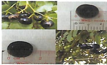
Hình 1. Hình dạng và kích thước của trái giác ( Cayratia trifolia ).