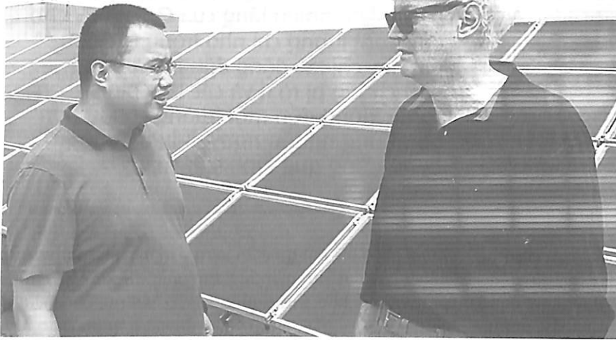
Nhà nghiên cứu Michael Grätzel (EPFL) tới thăm một địa điểm thử nghiệm pin perovskite ở Ngạc Châu, Trung Quốc.

từ âm 40°C đến 90°C tới 100 lần, thậm chí bị mưa đá bắn phá.